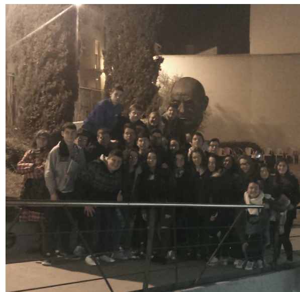
El grupo, junto al busto del Buñuel, a la salida del Centro dedicado al cineasta en Calanda, su pueblo.

Después de un largo desplazamiento concluimos este viaje didáctico en la localidad de Calanda, donde visitamos el Centro Luis Buñuel, famoso cineasta español del siglo pasado. En este museo interactivo que se centra totalmente en su vida y en su camino al éxito, los alumnos pudimos disfrutar de una visita guiada con numerosas explicaciones sobre algunos episodios y anécdotas importantes de su vida. Finalizada esta visita, regresamos a Teruel cargados de conocimientos.